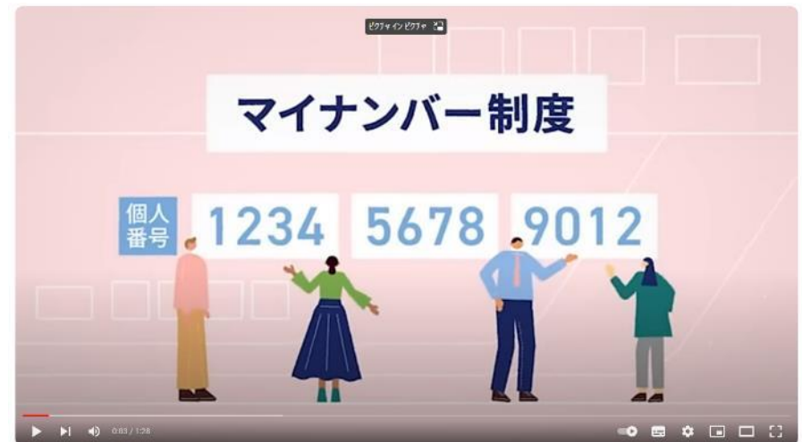
マイナンバー 制度「報告」と「対策」

マイナンバー 制度「報告」と「対策」 (youtube.com) https://www.youtube.com/watch?v=cPGselFiWxc