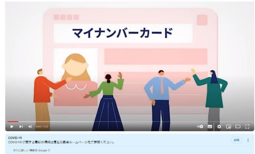
マイナンバーカード「いま」と「これから」

マイナンバーカード「いま」と「これから」 (youtube.com) https://www.youtube.com/watch?v=N2HlIPjnobY